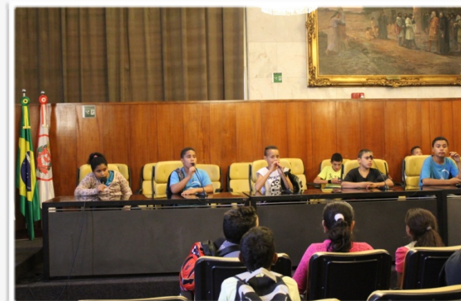
Participação na Câmara Municipal de São Paulo