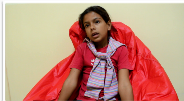
Documentário – “Reflexões sobre os Direitos Humanos”