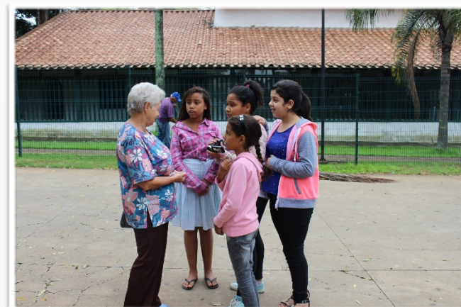
Ouvindo Histórias dos Moradores da Comunidade