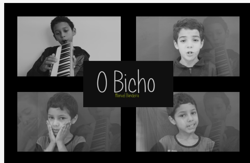
Série: Direitos Desumanos