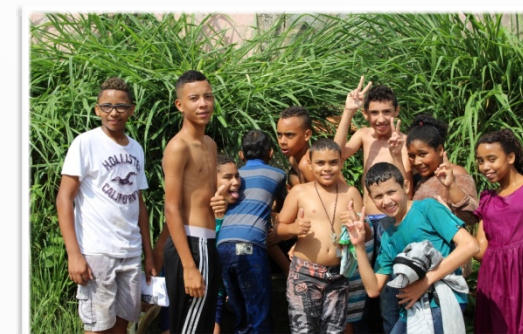
Visita a Casa Bandeirante Sítio Mirim