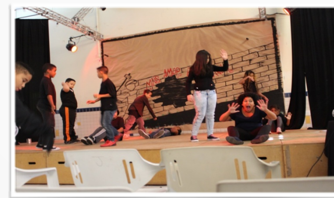
Estruturação final para o Teatro Documentário