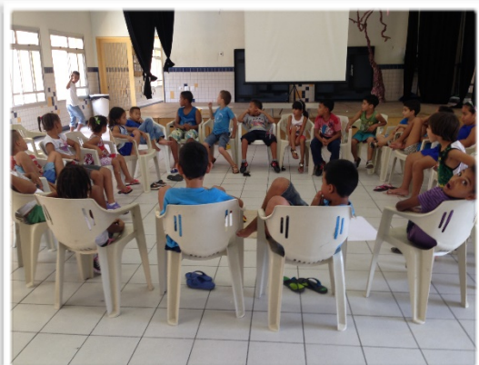
Discussões sobre Direitos Humanos